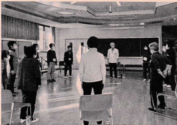
▲シルバーリハビリ体操

椅子に座って、床に座って、寝ていて、立っていて等、道具を使わずに出来る体操です。