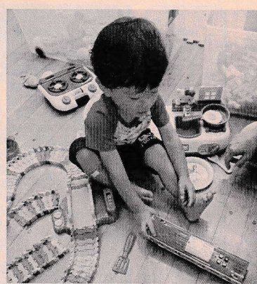
▲新しいおもちゃで!!

毎年恒例になっております「仲 町みんなの運動教室」が4回コー スで実施されました。 延べ40名の参加があり、楽しく 行うことができました。