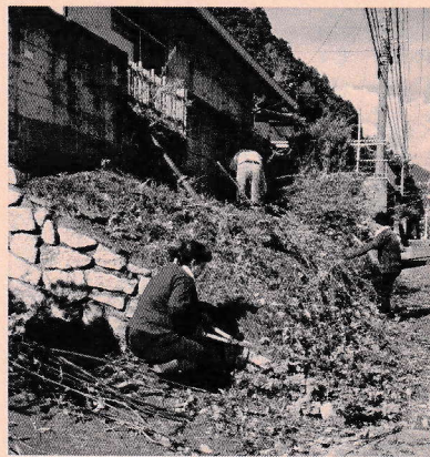
▲すっかりきれいになりました

今回は、市社協の職員、民生委員、交流センターの職員ほか、「ただいまコーヒー」のオーナーも加わったの作業でした。きれいななったお庭を見て利用された方の嬉しそうな笑顔が印象的でした。