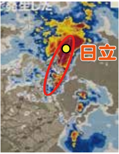
図2 線状降水帯