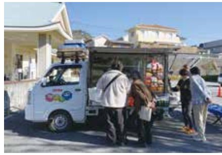
仲町交流センターに来た移動販売車

1月17日(水)に仲町交流センターに移動販売車が来ました。これから毎週水曜日の12時15分頃に来ます。近所の皆さんご利用ください。