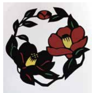
切り絵教室の作品

今回は色紙に貼るテーマの『椿』と『節分』です。参加者も落ちていてテキパキと切り進めていきました。みなさん必要なところは集中されていますが、落ち着いて教室を楽しくまわっているようでした。(仲町学区ホームページより)