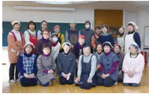
みそづくり教室の皆さん

し、常陸太田産の大豆を煮てつぶし、静岡産の塩を混ぜて合わせみそが出来上りました。参加者はリピーターが多かったこともあり、手際よく進みました。 先生のユーモアを交えた温かいご指導のもと、笑顔があふれる教室となりました。 6カ月後にはおいしい「みそ」になります。その時が待ち遠しい限りです。