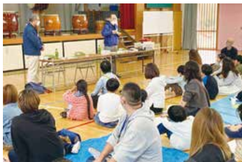
竹とんぼづくりに参加した皆さん

す。でも3回目にとぼした時に顔にとんできて、下くちびるに当たってしまいました。すぐにみんなが、しんぱいしてくれました。 うれしかったです。こんどリベンジして、きれいに飛ばしたいと、おもいました。