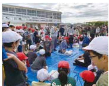
仲町地区防災訓練 (仲町小学校)

2月3日、福嶋アダム氏の講演が日立市消防本部でありました。その時の話に、例えば「地震のハザードマップ」で、今後30年間、震度6弱以上の確率は神峰町で51%、震度5弱以上は100%とのこと。また宮田川の水位は国土交通省の「川の防災情報」で逐次わかるなど、その他にも「あなたの街の防災情報」など活用できる情報が沢山あります。スマホで簡単に検索できますので、今後の台風などの避難判断に利用して頂ければと思います。