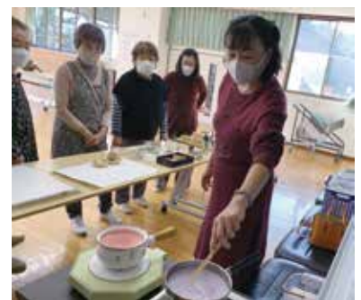
クラフト教室の様子

「取っ手付き籠 薔薇の飾り」、「北欧風のノエルプレート」等に挑戦しています。参加者それぞれの個性あふれる深みのある作品が出来上がっています。