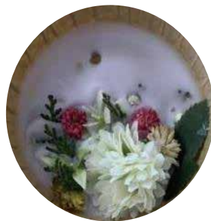
クラフト教室の作品