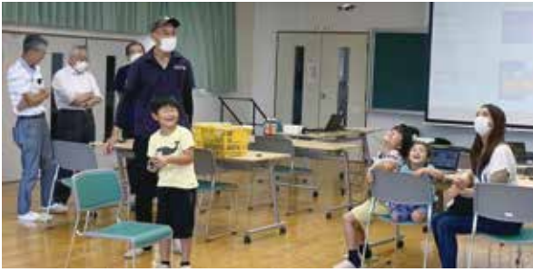
ドローンの疑似体験