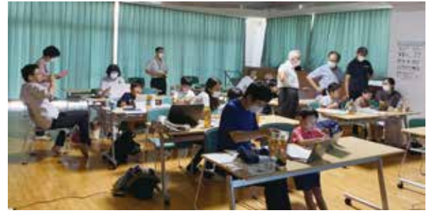
スクラッチプログラミング中です。

茶の湯をとおして非日常をあじわい、相手によりそい、感謝の心を・・・ 正座が苦手でもお茶に気軽に親しめるように企画したテーブル茶道の体験会になりました。 体験会では「茶の湯」の起原からはじまり、千利休の登場で『茶道』が確立され、そこから「一期一会」