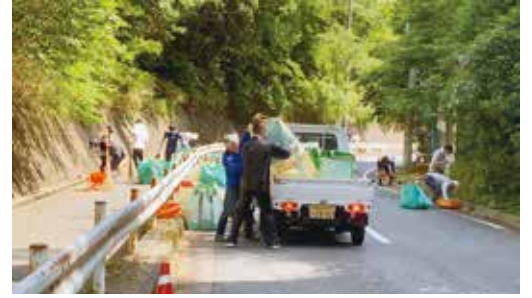
通学路清掃作業の様子