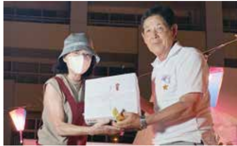
お楽しみ抽選会で1等賞当選者