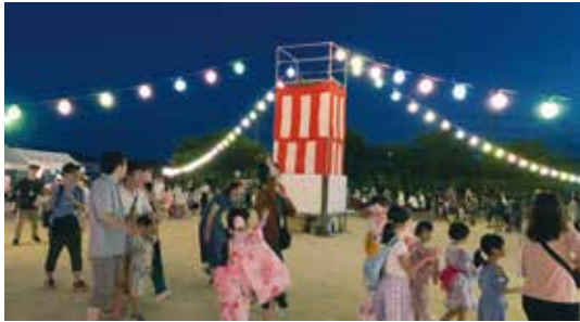
提灯でてらされた盆踊り会場