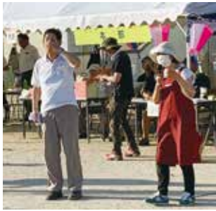
会長・副会長の開催宣言

また日立風流物西町支部の『子ども鳴物』をスタートさせその躍動感ある演奏に聞き入りました。全員でビンゴゲームを楽しみました。その後模擬店での販売も開始され大勢の参加者でにぎわいました。久しぶりの盆踊りのあとはお楽しみ抽選会で締めくくりました。