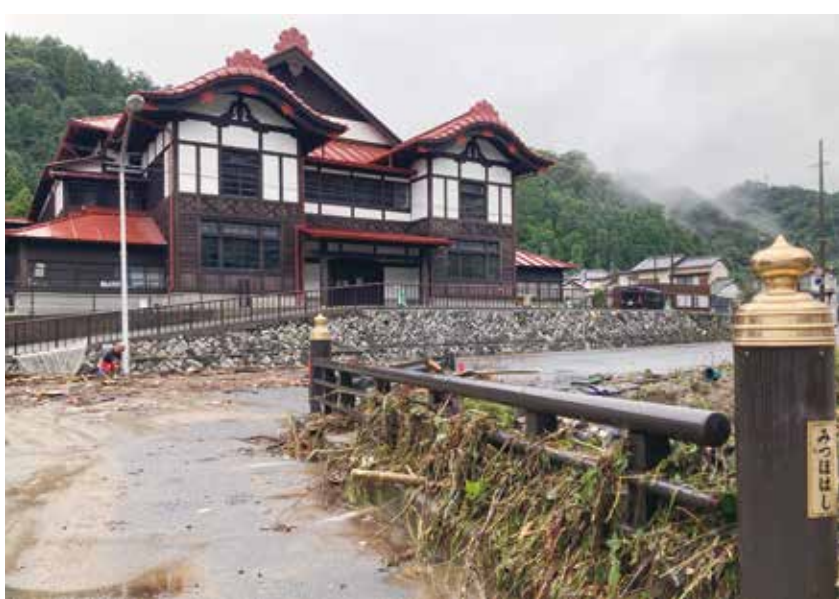
宮田川氾濫でみずほ橋欄干にたまった流木 奥は日立武道館(旧共楽館) 9月9日朝6時45分撮影

仲町コミュニティ推進会役員と仲町交流センター職員が中心となり、ボランティア13名が9日朝8時から被災された家屋の後片付けを手伝いました。床上浸水した家の中には、畳の上に土砂が数センチまるなど家財道具のほとんどが使えない状態でした。