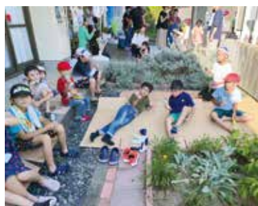
楽しかった『わんぱく隊 2023』

いと思いました。水遊びでは、去年も同じことをやりましたが、今年はほかの学年と協力しながら戦うことができたので楽しかったです。 花火では、時々激しくうちあがっていたので、美しいと思いました。 もし打ち上げ花火がまた見られたらまた見たいです。わんぱく隊に参加してみたい異学年と一緒に関わることができました。小学生最後のわんぱく隊、楽しかったです!