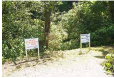
一の鳥での清掃作業の様子

日(日)に行いました。 昨年度に設置した不法投 棄禁止看板の効果により一 の鳥の駐車スペースには不 法投棄はありませんでした。 今回は、実施予定日(土 曜日)が雨のため日曜日に 順延しましたが参加人員が 少なかったため次回に期待 します。